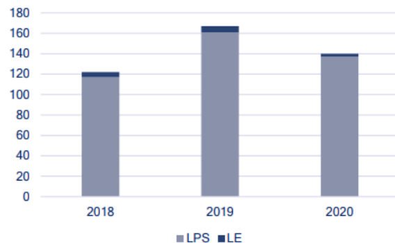
Figure 5. Flux de nouveaux EP, EME et PSIC déclarant exercer en France sous couvert du "passeport »